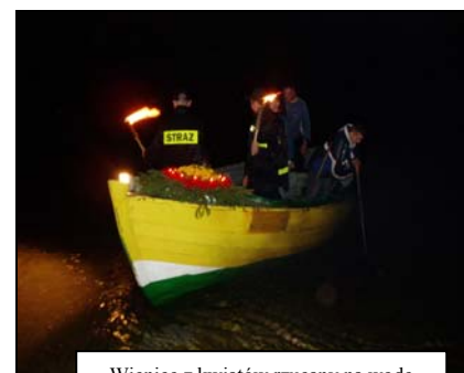
Wieniec z kwiatów rzucany na wodę