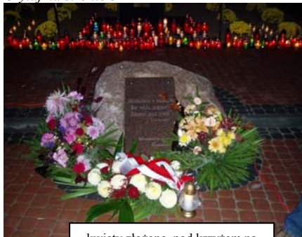
kwiaty złożone pod krzyżem na Alei Zasłużonych Ludzi Morza