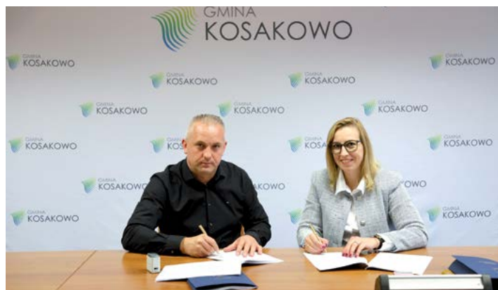
W dniu 8 października 2025 r. zawarto umowę na budowę ul. Daliowej w Kosakowie.

Wyłoniono Wykonawcę prac i w dniu 08.10.2025 r. zawarto umowę na budowę ul. Daliowej w Kosakowie. W ramach projektu zaplanowano budowę jezdnii bitumicznej, chodników, ścieżki rowerowej, oświetlenia oraz kanału