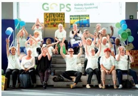
Gratulujemy zwycięzcom Senioriady - podopiecznym Klubu Seniora w Kosakowie